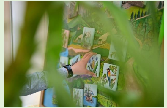
Élőlényfelismerés és elhelyezés természetes élőhelyén

A projektfeladat, amivel sokat dolgoztunk és a sok készülés meghozta a sikert. 2024. május 24-én Budapesten az ELTE Lágymányosi Campus Déli tömbjében a Természettudomány Kar adott otthont a Kárpát-medencei döntőnek, ahova a Kárpát-medence 1037 benevezett csapata közül a 12 legjobb csapat jutott be.