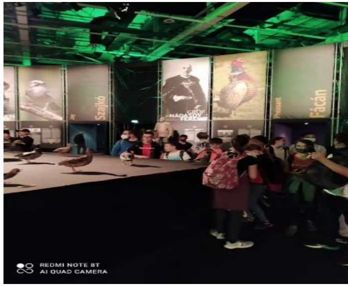
REDMI NOTE 8T AI QUAD CAMERA