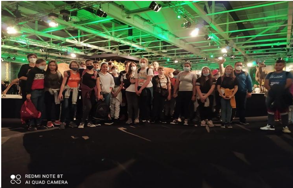
REDMI NOTE 8T AI QUAD CAMERA