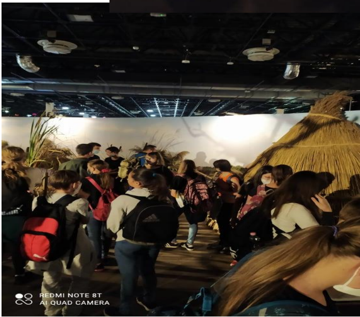
REDMI NOTE 8T AI QUAD CAMERA