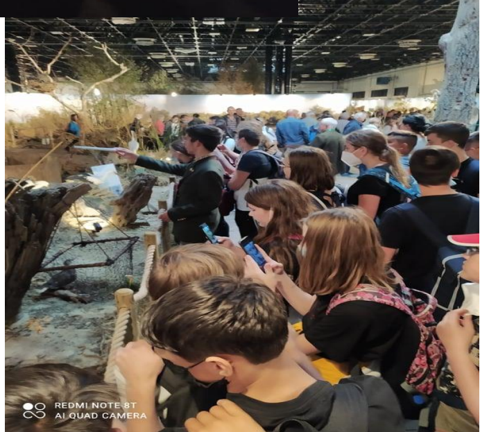
REDMI NOTE 8T AI QUAD CAMERA